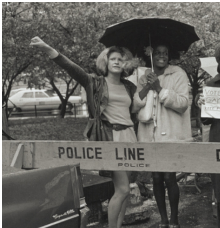
Sylvia Ray Rivera, Marsha P. Johnson na skupu u gradskoj vijećnici za prava gay osoba

Ovo je pokret kojeg su uglavnom pokrenule rasno marginalizirane trans žene, koje su također bile seks radnice, Marsha P. Johnson i Sylvia Rivera. Međutim, ovo nije samo povijesna stvar. Intersekcijske borbe i aktivistkinje' i na raskrižju višestrukih identiteta još uvijek guraju pokret na mnogo načina. No, to se često ne odražava u medijima, gdje se bijele trans osobe bez invaliditeta još uvijek često citira, dajući malo prostora nijansiranom shvaćanju i problemima s kojima se mnoge trans osobe suočavaju.